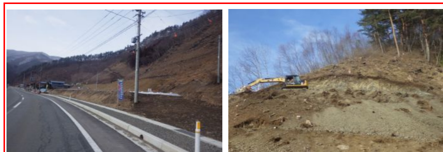
国道106号から見える急傾斜な岩盤の切土に着手しました。これから法面を安全に保つための特殊な法面工を施工します。