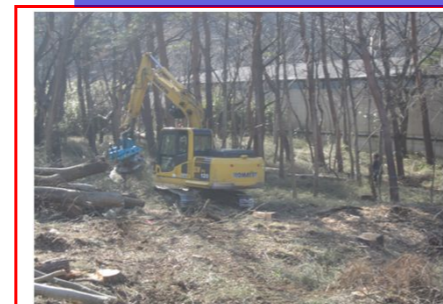
茂市腹帯工区の起点で伐採作業をしました。