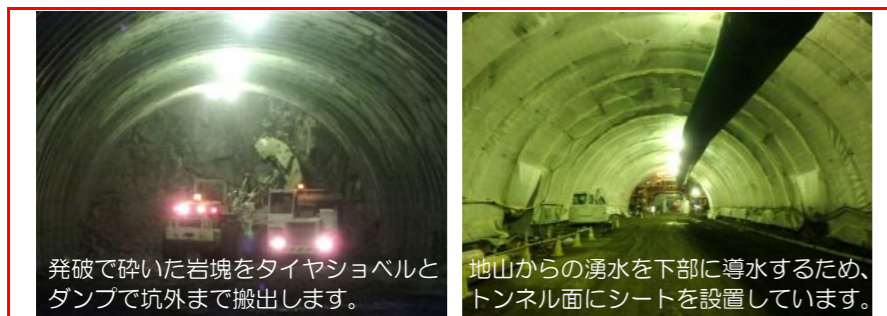
発破で砕いた岩塊をタイヤショベルとダンブで坑外まで搬出します。地山からの湧水を下部に導水するため、トンネル面にシートを設置しています。

千徳14地割(宮古浄化センター南)から小山田トンネル(仮)を東側に向かって掘り進んでいます。1100mの内200mほど進みました。※左上写真「発破」：堅い岩をダイナマイトでほぐすこと。