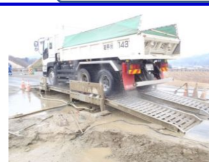
大型ダンプ専用のタイヤ洗浄機で洗い空転させてから現場を出発しています。