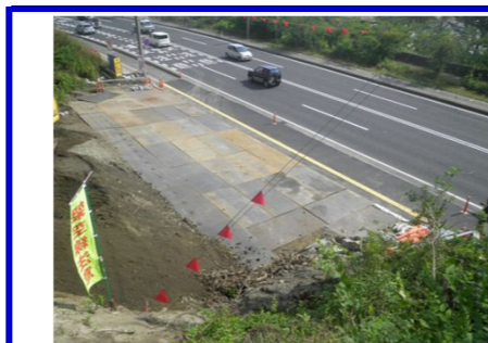
大型ダンプのタイヤに土が付着しないように鉄板を敷詰めています。

千徳14地割(宮古浄化センター南)から小山田トンネル(仮)を東側に向かって掘り進んでいます。1100mの内200mほど進みました。※左上写真「発破」：堅い岩をダイナマイトでほぐすこと。