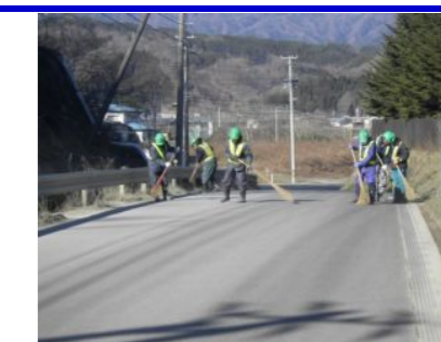
人手により道路を清掃しています。