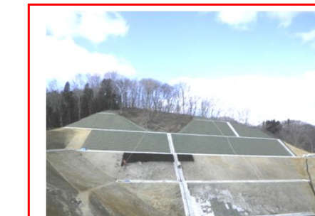
山の斜面を植生で保護する為、吹付け作業を行っています。