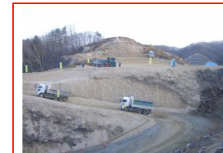
道路が出来る範囲を削って、大型ダンプで土を搬出しています。