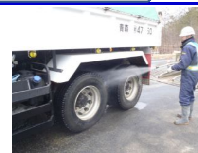
道路に出る前にタイヤを洗っています。